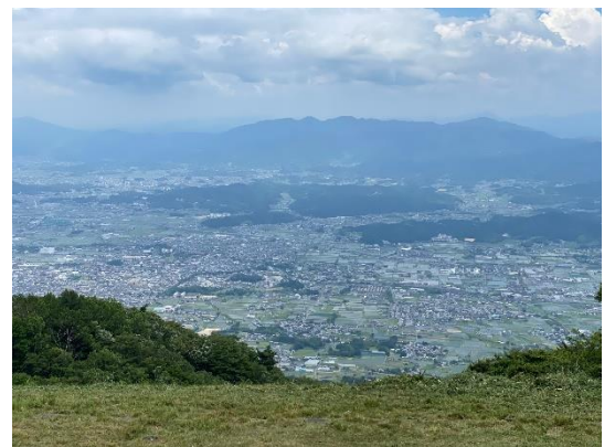
12:36 パラグライダー広場