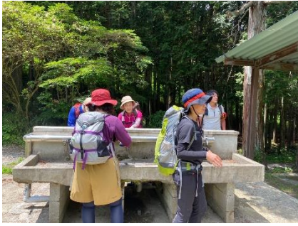
11:21 葛城高原キャンプ場で手を濡らして涼をとる