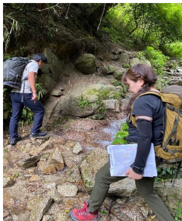
天狗谷沢を左右に行き来して進む 石の上を踏むと滑りやすいので沢に入ってしまったほうが 滑りにくい場合もあります