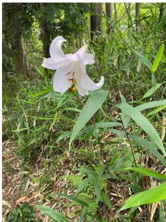
ささゆりも咲いてました！