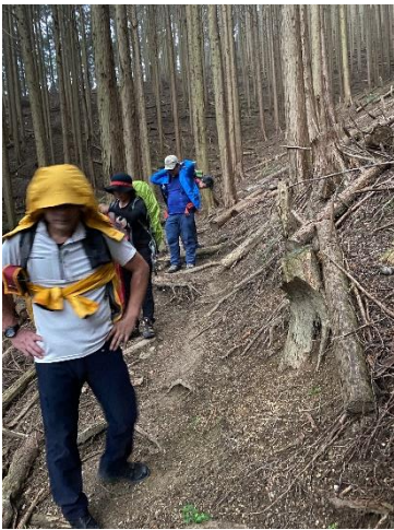
14:50 雨がぱらついてきたのでレインウェア装着 スクールで初めてのレインウェア 素早く装着