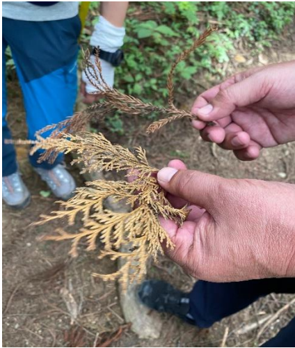
ヒノキとスギの違い 上がスギ、下がヒノキ