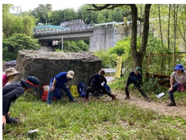
入念にストレッチして9:27 出発