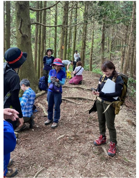
14:31.太尾道一ノ瀬で下山決定