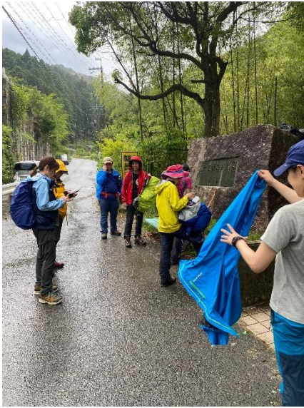
15:16 葛城登山道まで下山後水越峠まで移動