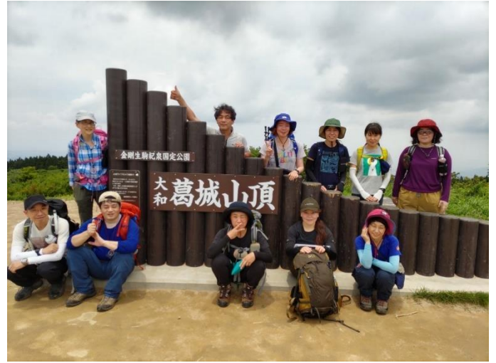
11:44 葛城山頂到着、集合写真、日陰で昼食 12:21 まで