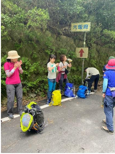
13:28 水越峠へ到着後 ストレッチ