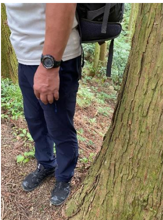
斜面での休憩の取り方 木の生えている下側は斜面なので 木の生えている山側に立つと斜度が少なく足の負担も少ない