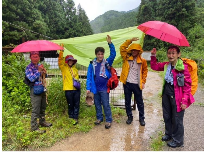
15:43 水越峠バス停到着 ツェルトで雨をしのぎます