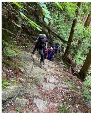
鎖場は一人ずつ気を付けて登っていきます